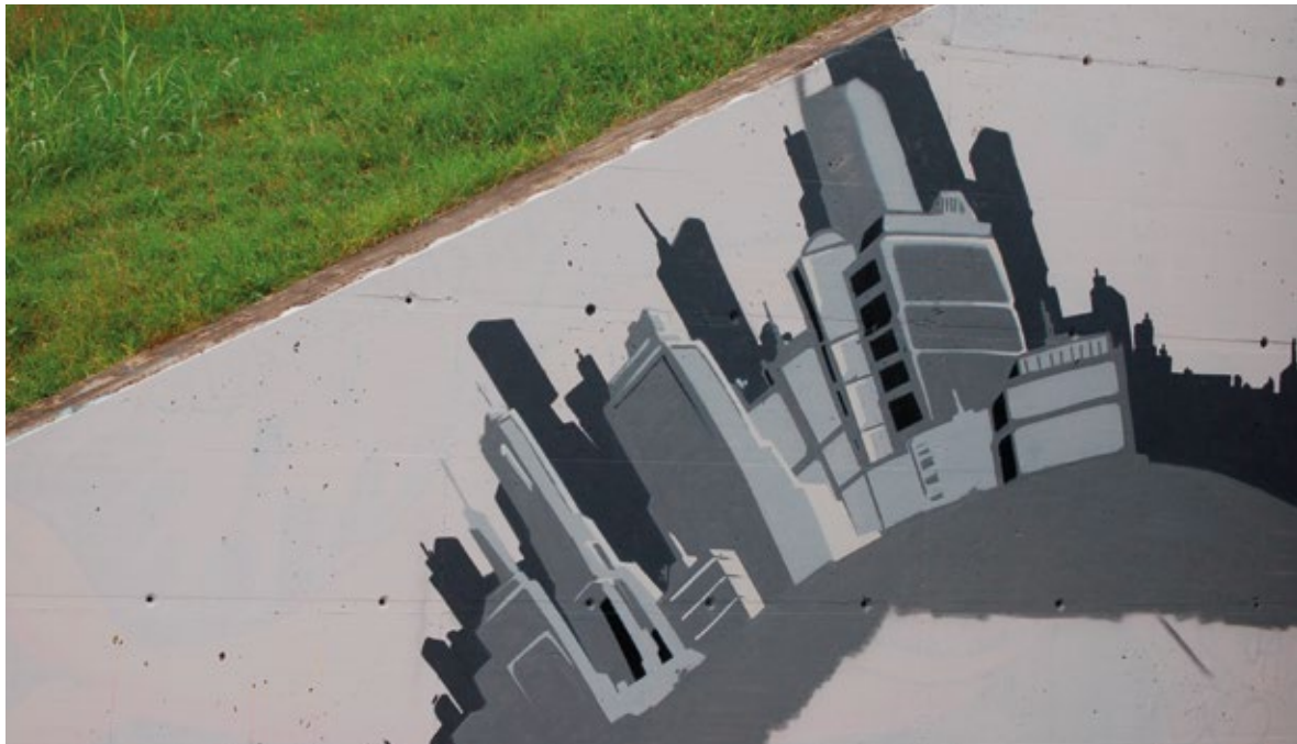
Vaje na odru