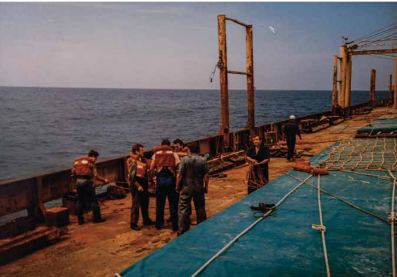
Posadka v času alarma Človek v morju