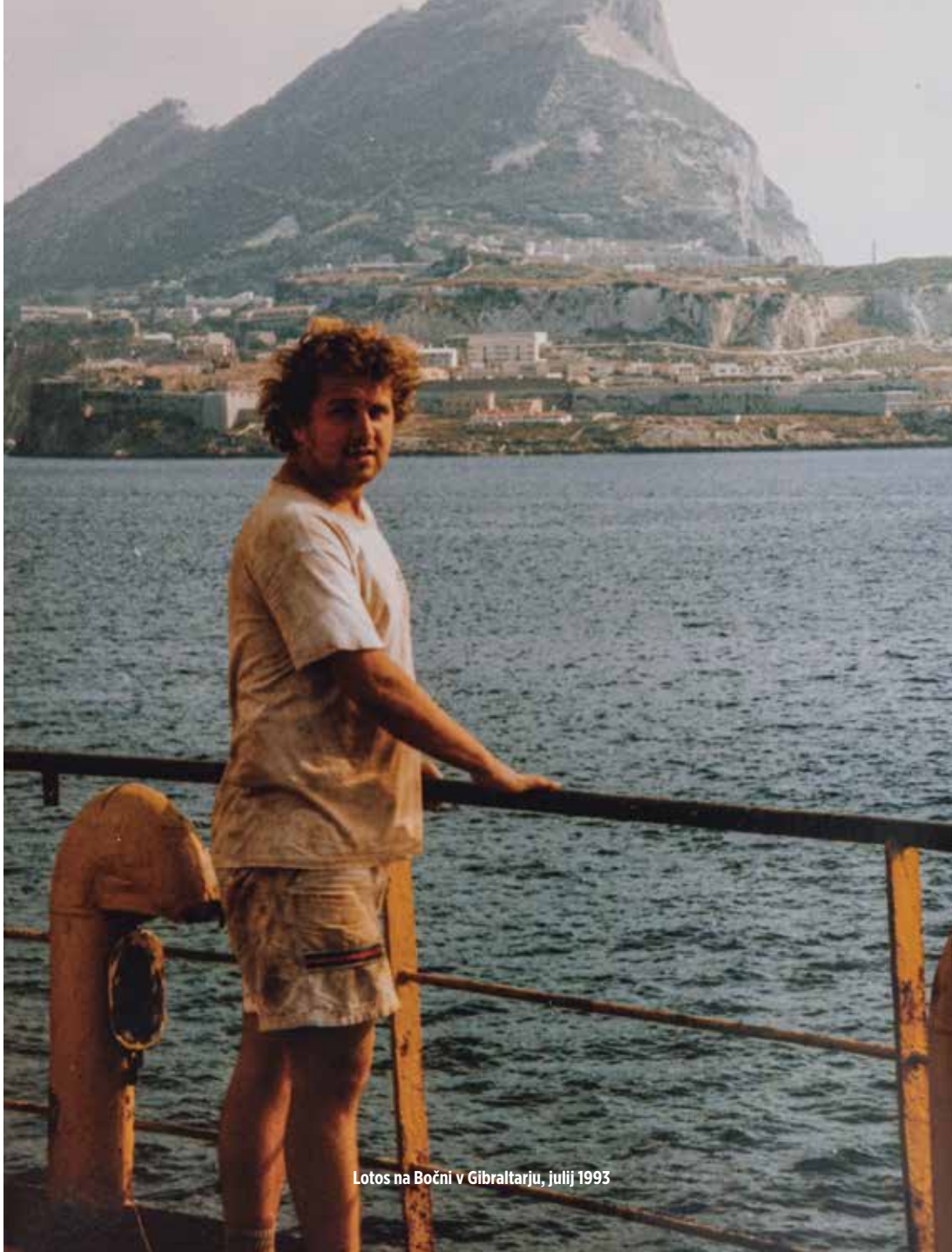
Lotos na Bočni v Gibraltarju, julij 1993