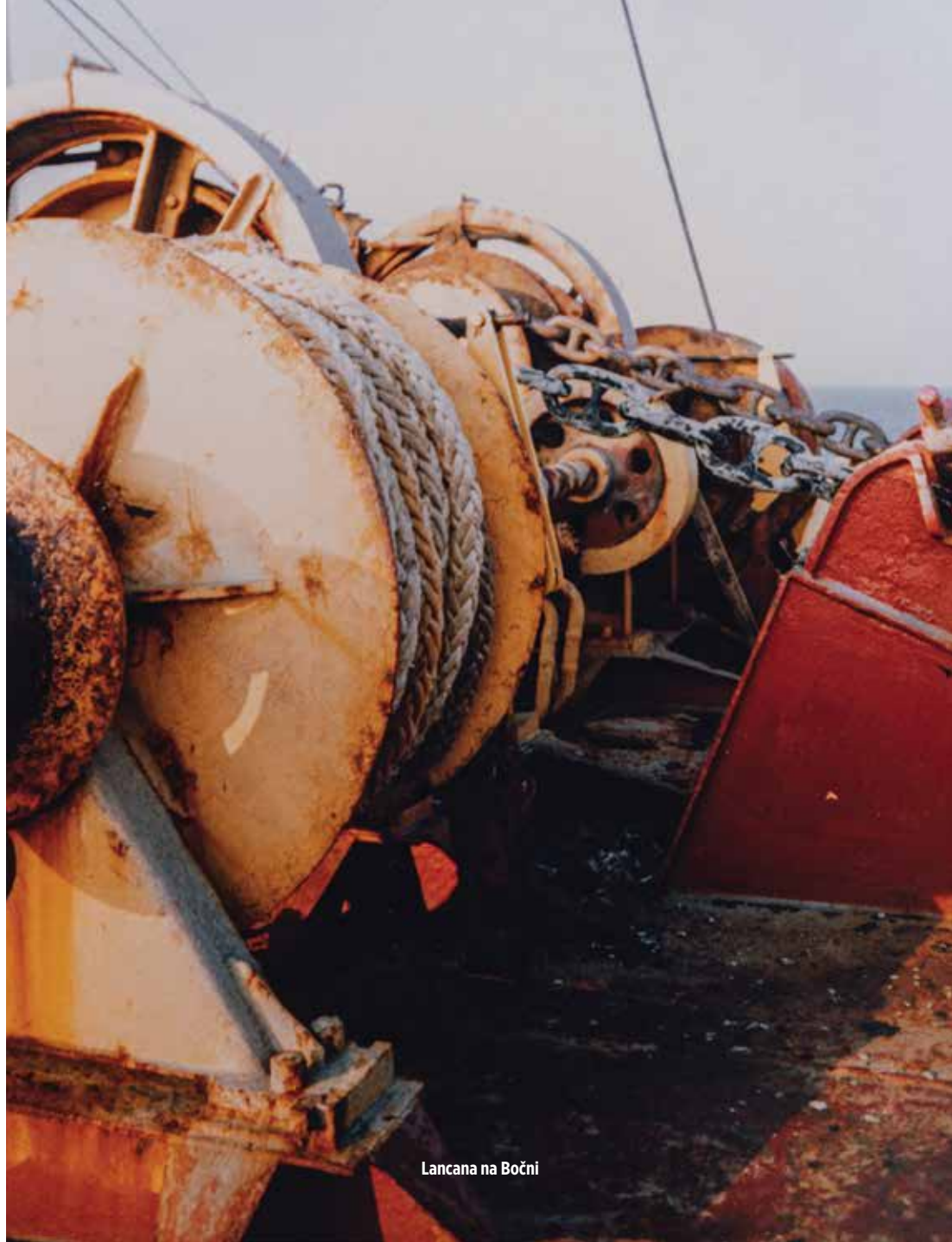
Lancana na Bočni