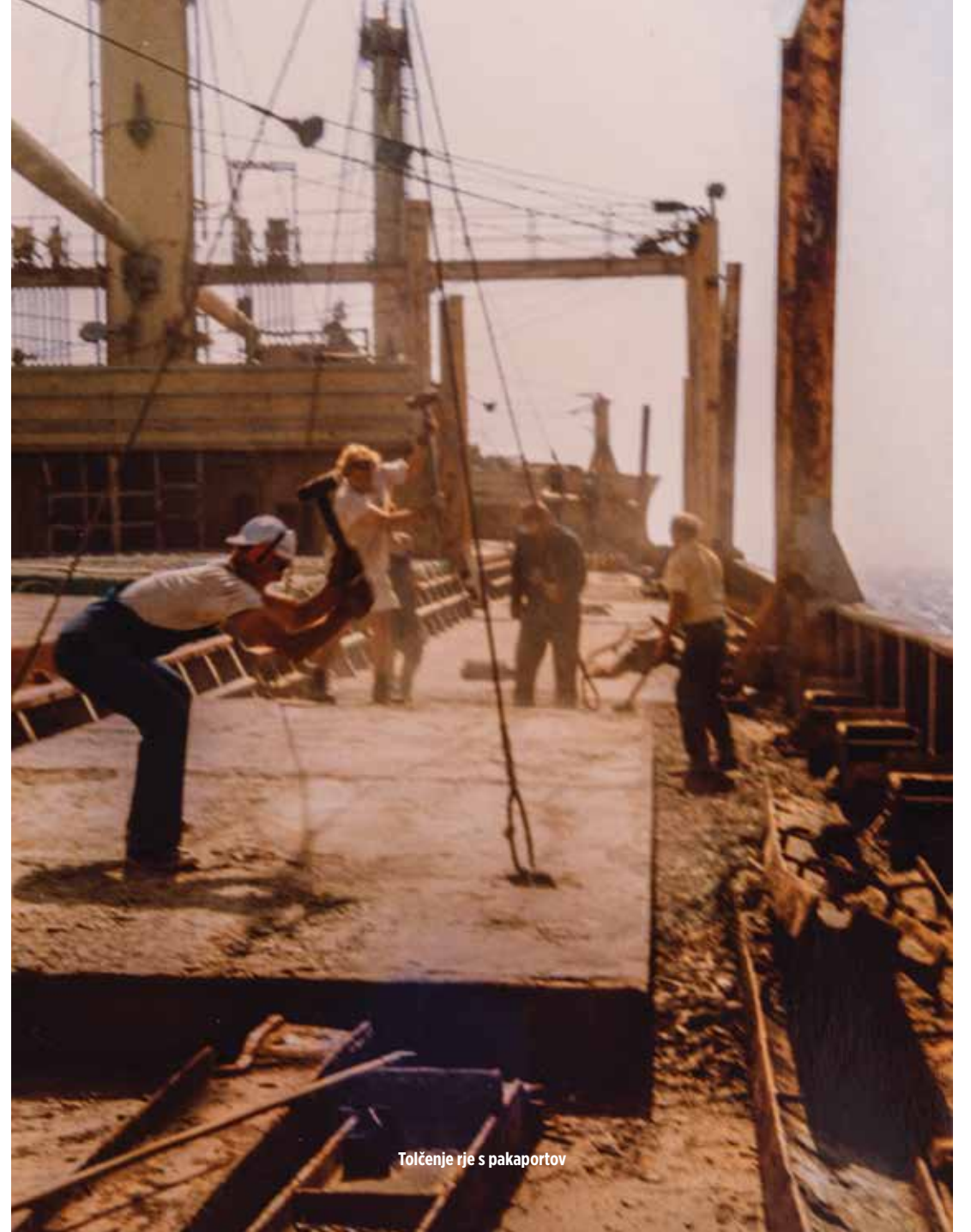
Tolčenje rje s pakaportov