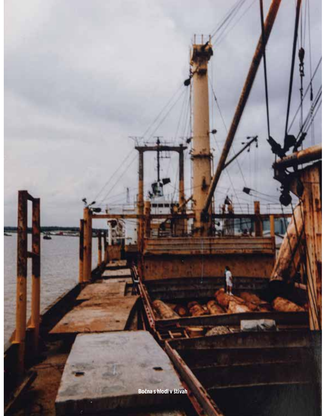
Bočna s hlodí v štívah