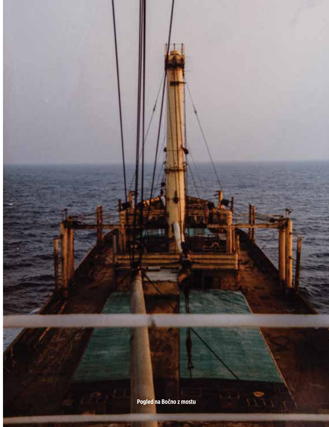
Pogled na Bočno z mostu