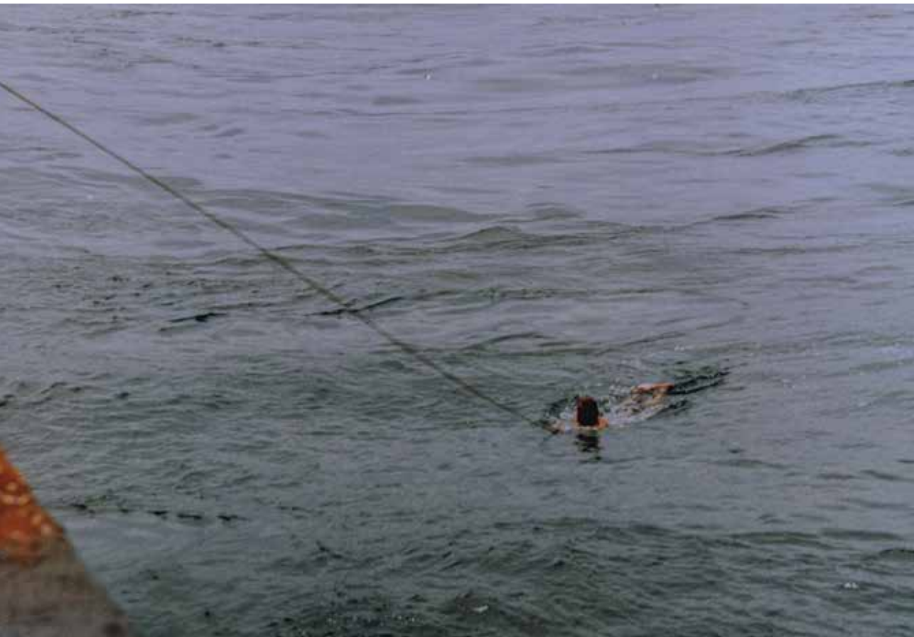
Vleka k ladji

norec. Sploh tisti, ki jadrajo sami. Dneve in tedne in mesece na zibajočih se dveh kvadratih. No, še večji norec se gre pa kopat sredi Atlantika. Hahahaaaa. O, val.