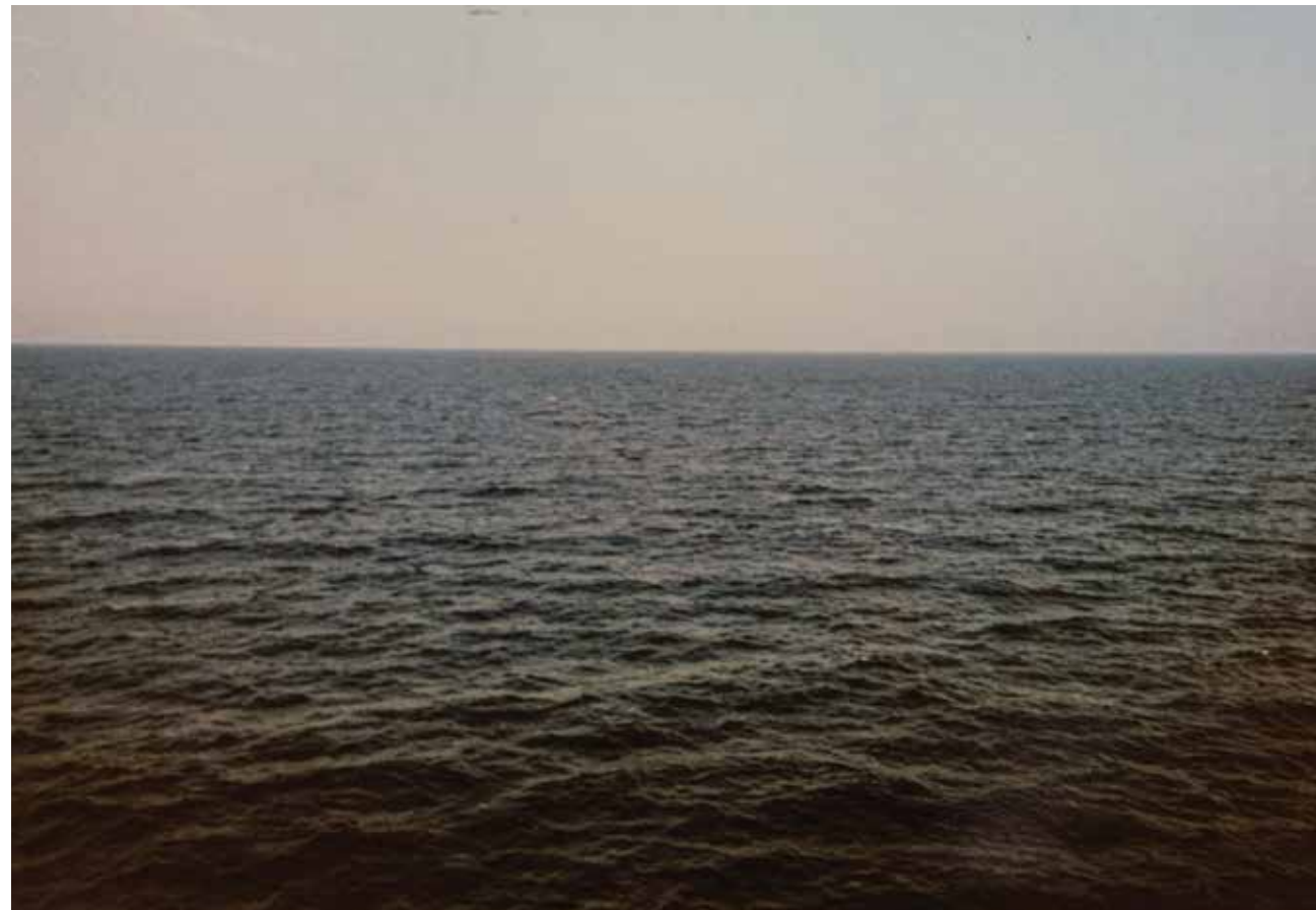
Atlantik 9. 7. 1993 – mrtvo morje