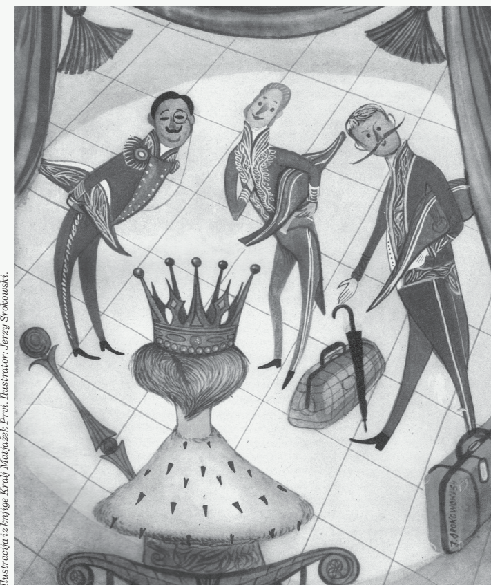
Ilustracija iz knjige Kralj Matjažek Prvi . Ilustrator: Jerzy Srokowski.

Grški ekonomist, predavatelj in bivši finančni minister Janis Varufakis je knjigo Ta svet je lahko boljši – moji pogovori s hčerko o ekonomiji napisal v obliki pogovorov s hčerko iz prvega zakona, ki živi v Avstraliji. Knjiga prinaša osnove ekonomije za najstnike, pa tudi starejše bralce. Razlaga ekonomske pojme in procese, ki bi jih moral poznati vsak, pa zgodovino gospodarstva in