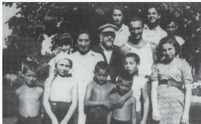
Janusz Korczak z otroki in osebje Doma Sierot.

Ljudje, ki so opazovali odhod Korczakovih otrok iz geta na železniško postajo, pravijo takole: Hodili so v koloni po dva in dva. Oblečeni so bili v svoja najboljša oblačila, vsak od njih je imel s sabo svojo najljubšo knjigo ali igračo. Hodeč skozi mesto so peli, eden izmed njih pa naj bi tudi nosil zeleno zastavo kot simbol vseh otrok. Tako so se uprli nesmiselnosti vojne in brezumnemu ubijanju, v zgodovino pa se je dogodek vpisal kot Korczakov marš.