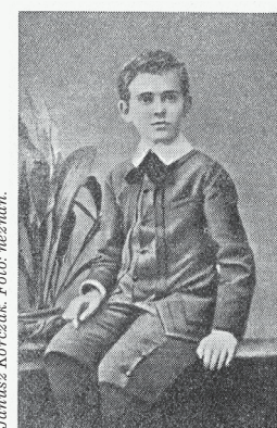
Janusz Korczak.