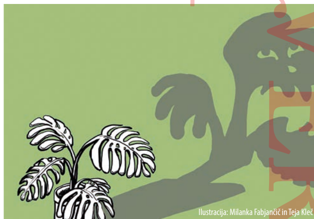
Ilustracija: Milanka Fabjančič in Teja Kleč

Odgovor najdemo v Zverjaščku , kjer je »velika zlobna miš« od takrat strah in trepet vseh majhnih kot tudi velikih zverjascev. Straši v temačnem gozdu, kamor se nekega dne kljub svarilom svojega očeta odpravi mali Zverjašček . Pa saj velika zlobna miš sploh ne obstaja ... Mogoče pa?! *