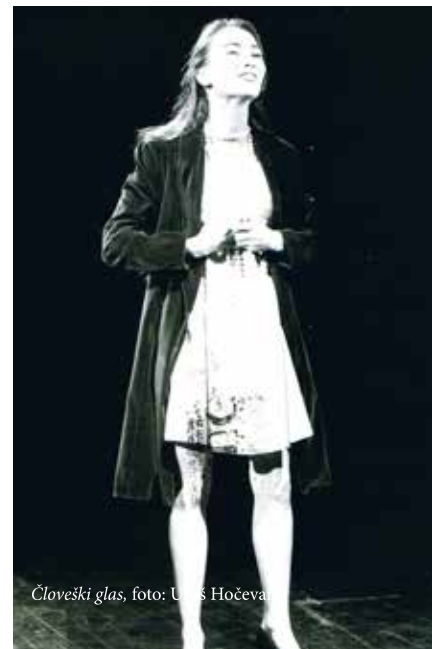
Človeški glas

Navkljub temu so želeli ŠKUC gledališče ukiniti.