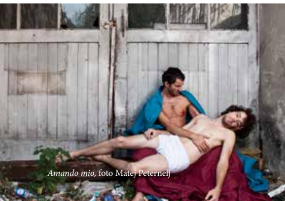
Amando mio