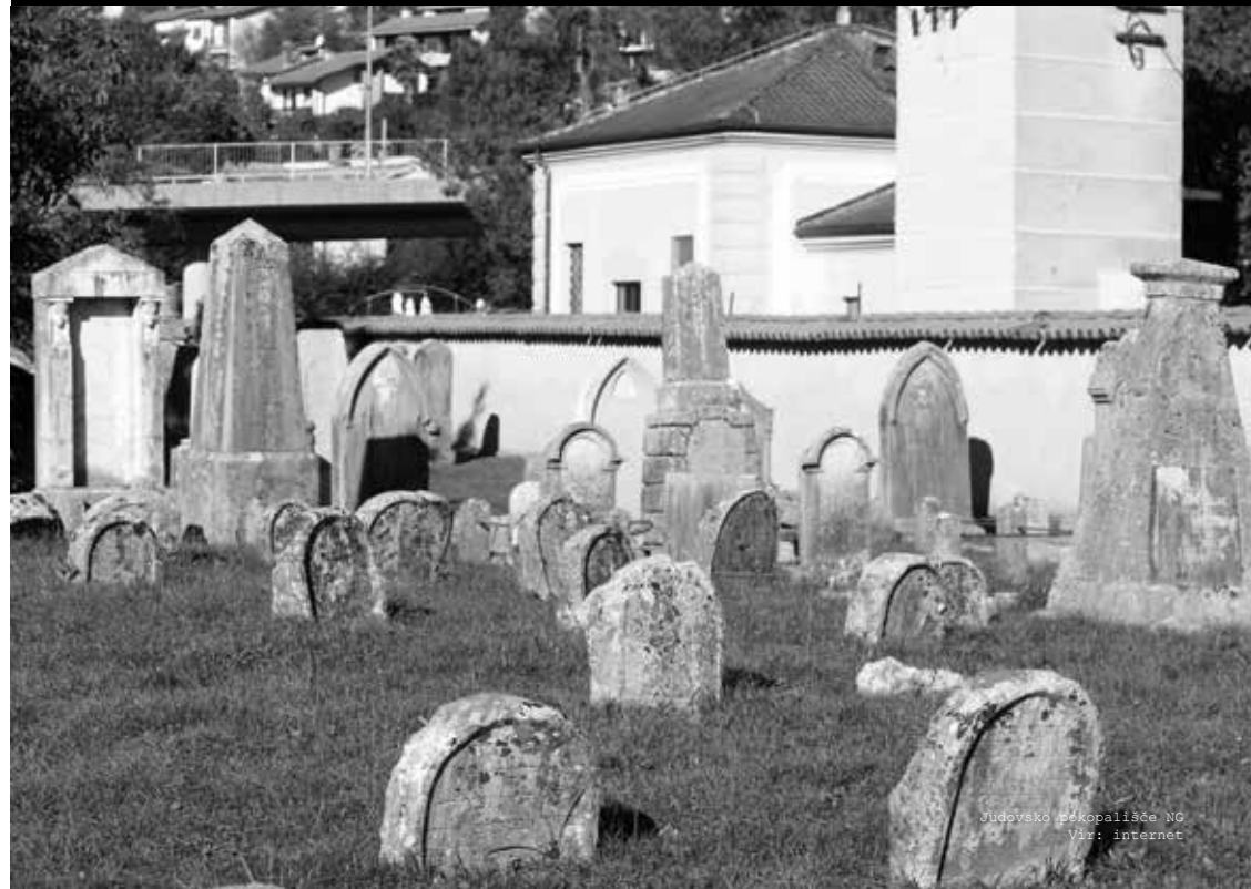
Judovsko pokopališče NG