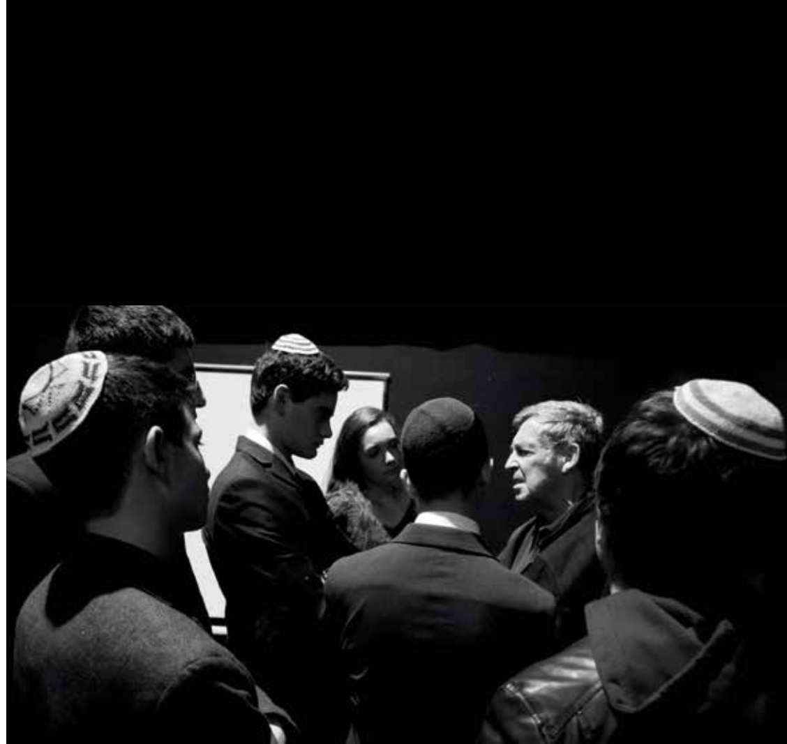
"Mladi izraelski ambasadorji" na obisku v JKC Ljubljana

Podoben tip lažne dileme se nam vsiljuje tudi zdaj, le da na mestu židovskega komunizma nastopa komunistična »kontinuiteta«, namesto »germanizma« izenačenje vseh totalitarizmov. Če bo, kljub vsem argumentom, na koncu prevladala resnica »bratov po krvi«, lahko tudi v slovenskem primeru začnemo govoriti o dokončni uveljavitvi selektivne amnezije oziroma o sistematičnem »oženju spomina«, ki namesto priznanja zločinov domobrancev slednjim zagotavlja »pasivno identiteto žrtev«.