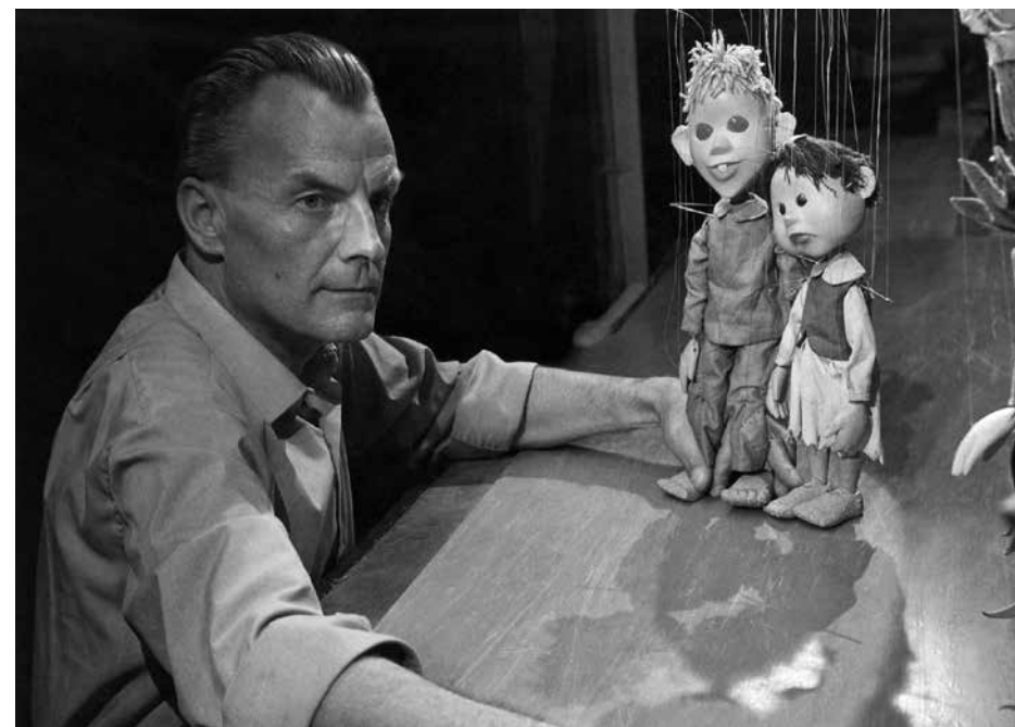
SINJA PTICA , REŽIJA JOŽE PENGOV, 1964

»Če ljudi ne morem naravnost vprašati, kako srečni so, jih vprašam, kako zadovoljni so s svojimi družbenimi odnosi, ter tako dobim odgovor.«