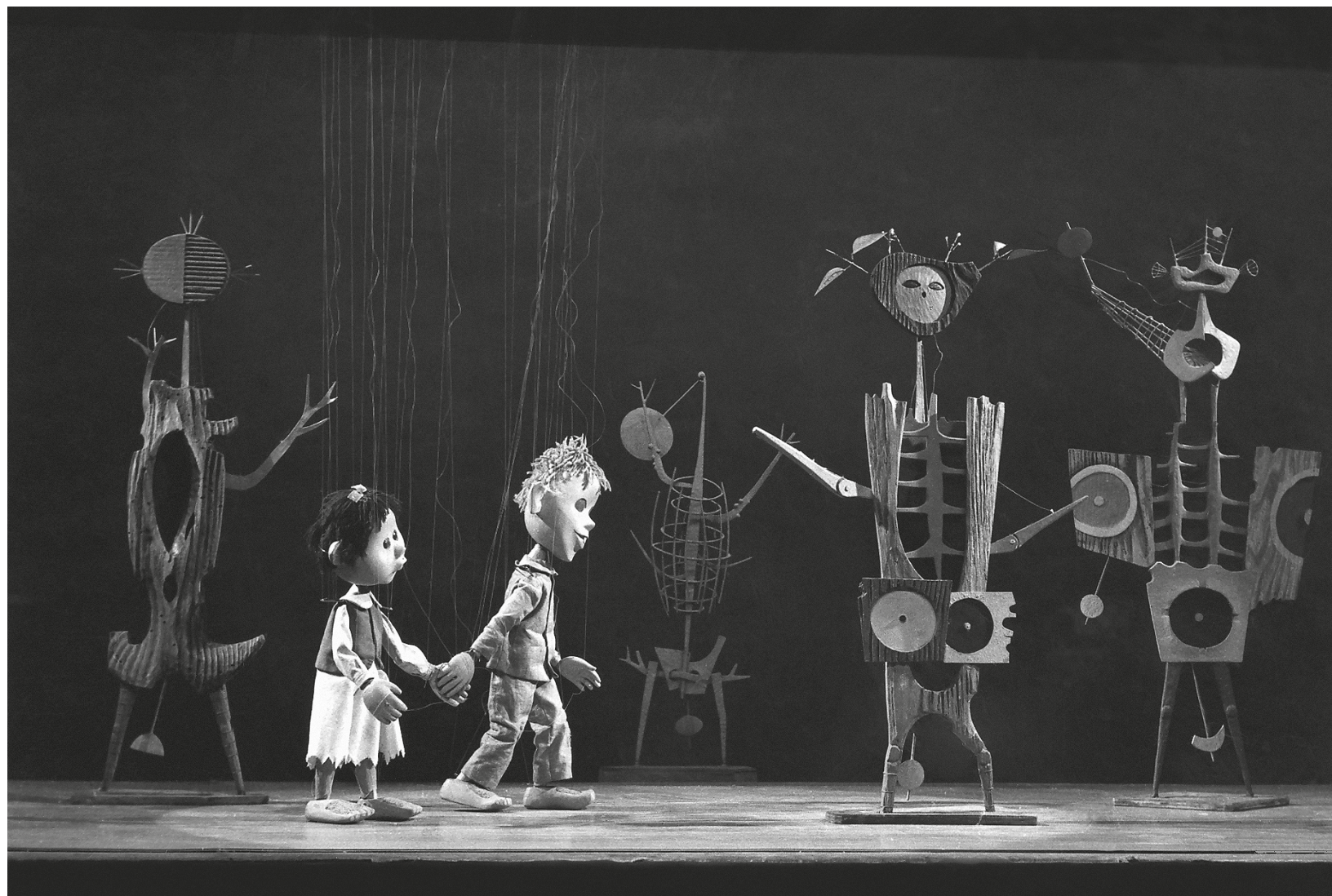
SINJA PTICA , REŽIJA JOŽE PENGOV,