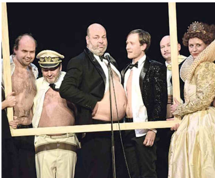
Kralj Ubu v ljubljanski Drami